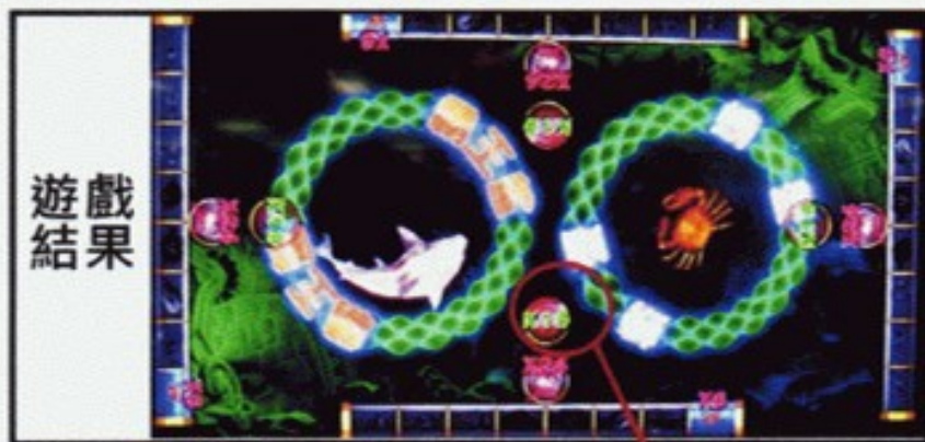
獎勵分數之倍數顯示於畫面中