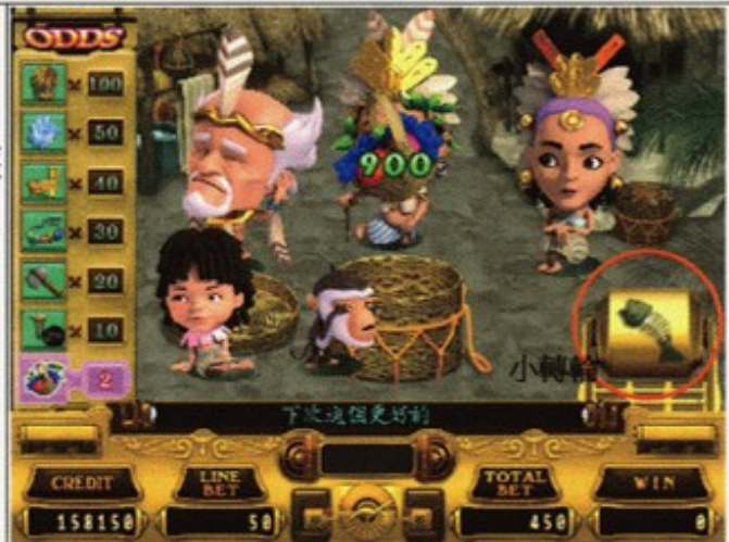
【土著交易倍數對應表】

土著會隨機決定是否喜歡交易的物品，當土著不喜歡交易的物品時便會離開，如果所有的土著都離開則遊戲結束。