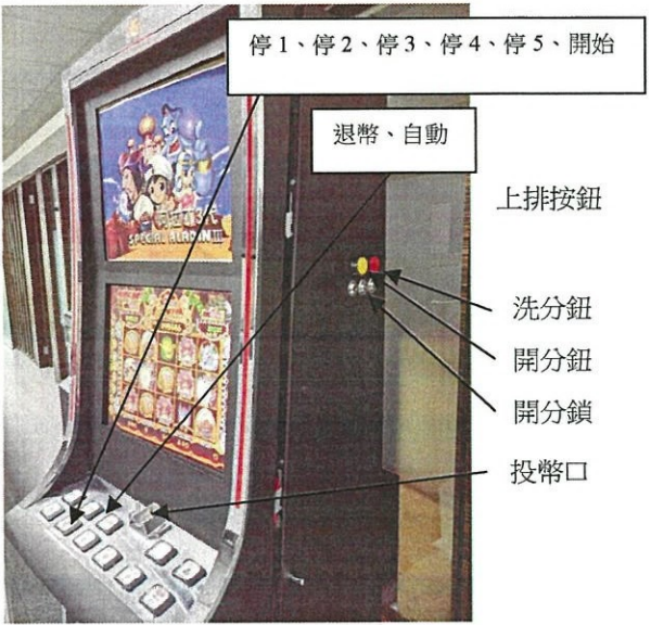
圖 片 介 紹