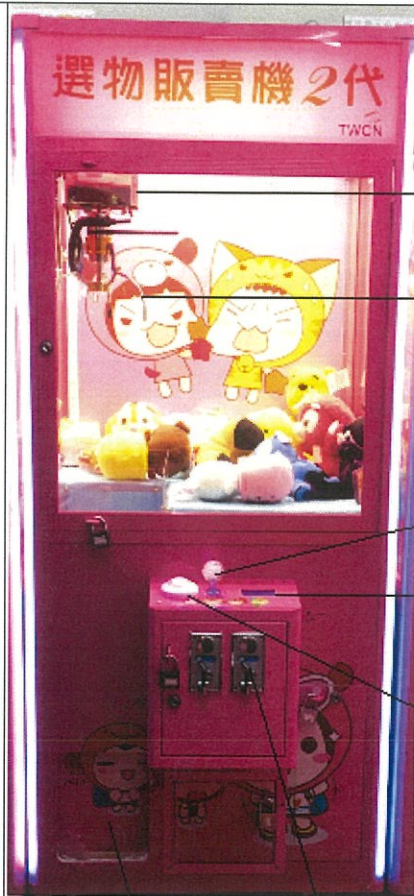
圖 片 介 紹