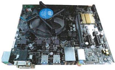
廣播報獎系統主機板