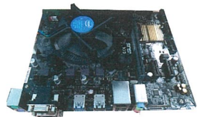
廣播報獎系統主機板