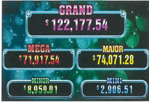
圖 片 介 紹