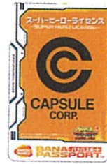
▲此為七龍珠英雄 卡片販賣機 店內對戰版圖示